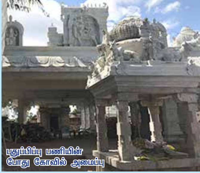
புதுப்பிய்பு பணியின் போது கோவில் அமைப்பு

இத்தடாகத்தில் அற்புதத் தாமரை மலர்கள் தோன்றின. தம் தவத்தின் நோக்கம் இறையருளால் நிறைவேறியதை உணர்ந்த சித்தர் கண்களைத் திறந்தார். அத்தாமரைத் தண்டு லிங்கமாக மாறிட, அத்தாமரை மலர், ஸ்ரீகுந்தளாம்பிகை அம்பாளாகத் தோற்றம் பெற்றது. ஸ்ரீதிரிபுவன சித்தரின் அற்புத தவத்தால் ஸ்ரீசோமநாதர் ஸ்ரீகுந்தளாம்பிகை தெய்வத் திருமூர்த்திகளுக்கு அங்கேயே ஒரு