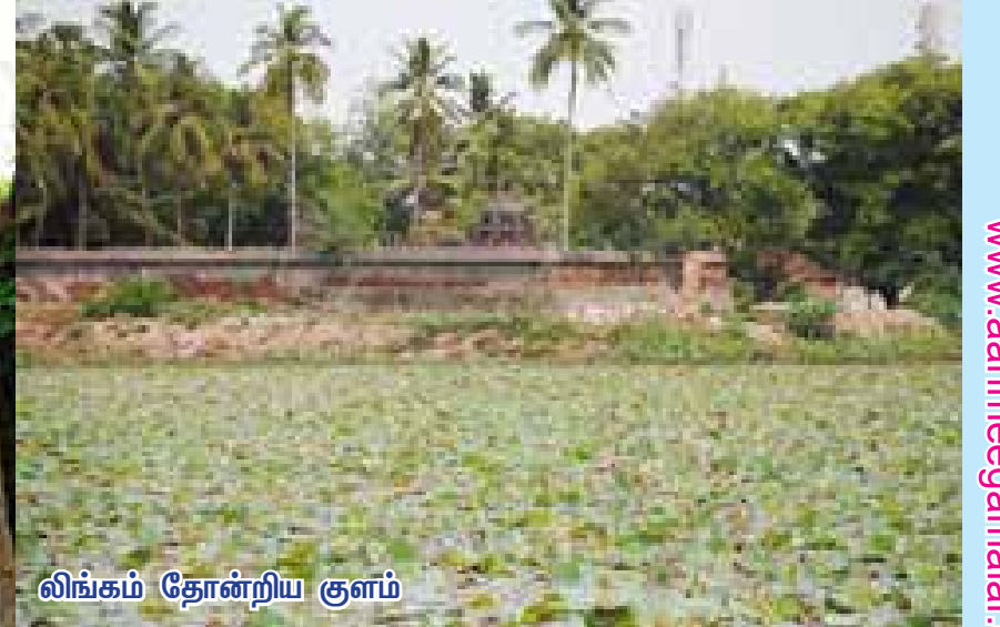
லிங்கம் தோன்றிய குளம்

பூலோகம், புவரலோகம், சுவரலோகம் என்ற மூன்று லோகங்களிலும் பெற்றுகரிய ஒரு தெய்வீகத் தாமரைப் புஷ்பத்தைச் சிவனருளால் பூலோகத்திற்குக் கொண்டு வர விரும்பினார்..