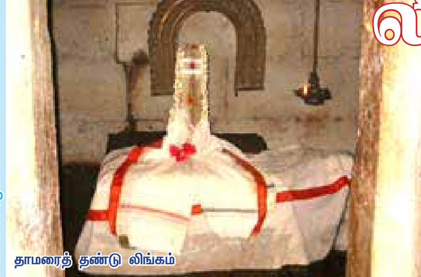
தாமரைத் தண்டு லிங்கம்