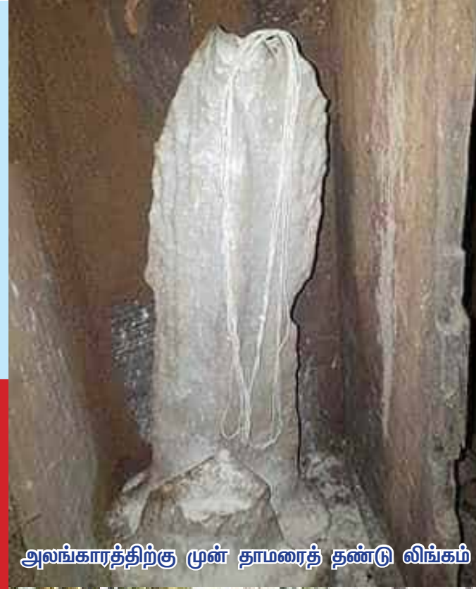
அலங்காரத்திற்கு முன் தாமரைத் தண்டு லிங்கம்